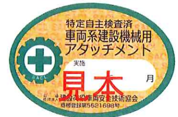
アタッチメント検査済シール (BP-KC-01,02)